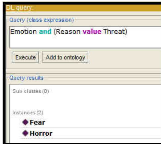
Şekil 3. Tehdit Sonucunda Oluşan Duyguların Sorgulanması

Oluşturulan ontolojinin doğrulanması aşamasında, gerçek dünyadan sensörler ile alınan verilerin işlenmesiyle ortamda bir tehdit algılandığı durum göz önünde bulundurulmuştur. Tehdit etmeninin söz konusu olduğu durumda oluşabilecek duygular ontolojide Fear ve Horror olarak tanımlanmıştır. Fear ve Horror duygularına Reason ve Result özellikleri için sırasıyla (Threat, Escape) ve (Threat, Attack) değerleri atanmıştır. Tehdit karşısında oluşacak duyguların ve gerçekleştirilebilecek eylemlerin sorgulanması için aşağıdaki sorgu oluşturulmuş ve sorgu sonucunda Fear / Horror duyguları elde edilmiştir.